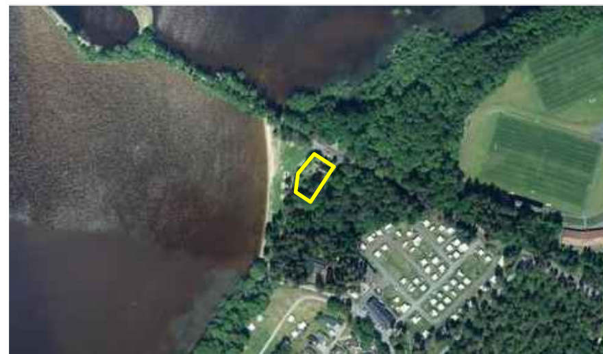
Orienteringskarta (ej skala)

GRUNDKARTA Upprättad av Kart och Mät, Bromölla kommun 2025-01-20 Avseende detaljplan för fastigheten Bromölla 11:88 Koordinatsystem: SWEREF99 13 30 Höjdsystem: RH2000 Edita Zidziuniene Mättningsingenjör