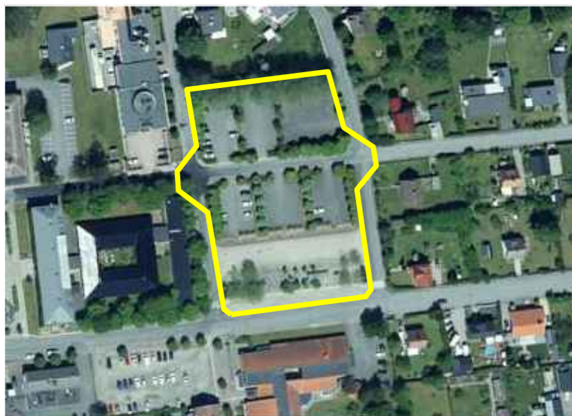
Orienteringskarta (ej skala)