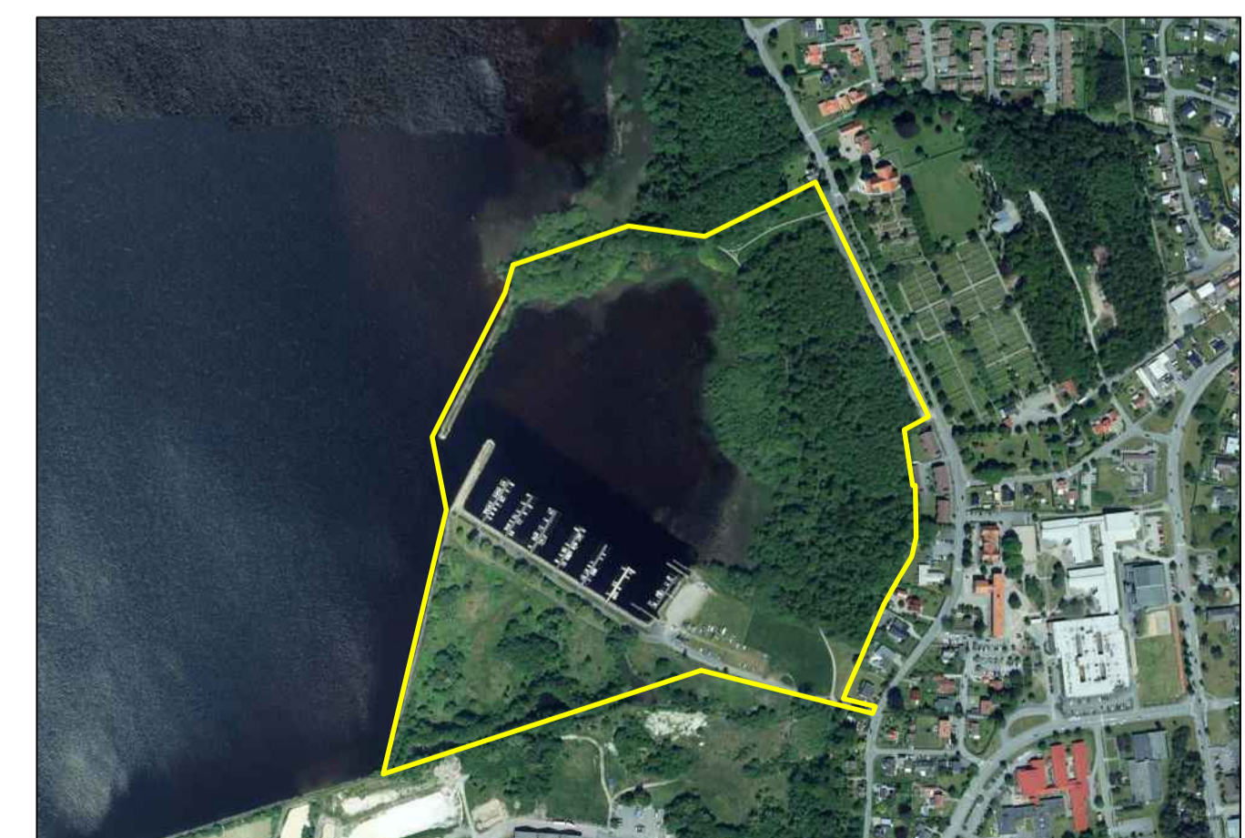
Orienteringskarta (ej skala)

0 20 40 60 80 100 120 140 160 180 200 m Skala 1:2 000, A1 L